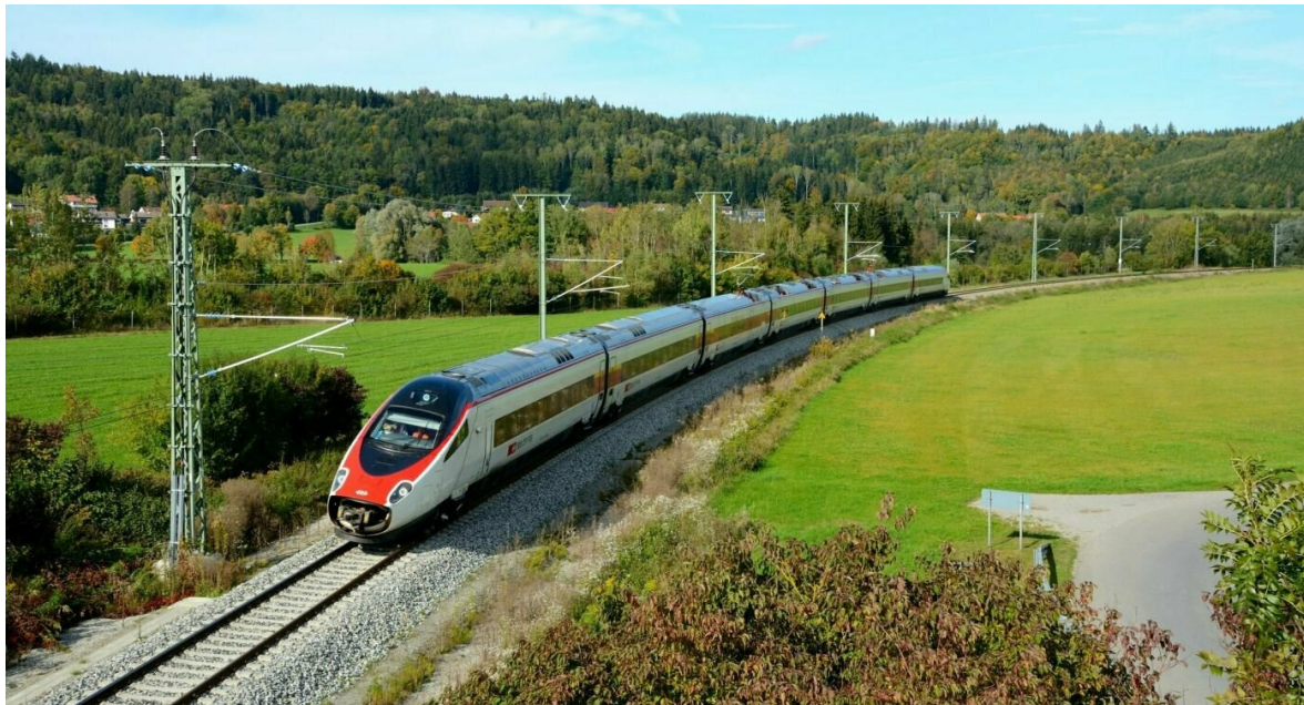
Der ETR610 unterwegs im Allgäu

Das neue Angebot verbessert deutlich die Konkurrenzfähigkeit der Eisenbahn im Vergleich zum Flugzeug, zum Busverkehr und zum motorisierten Individualverkehr. Dank der Elektrifizierung der Strecke fahren im Internationalen Personenverkehr der SBB keine Dieselloks mehr. Damit leistet die SBB einen aktiven Beitrag zu einer nachhaltigen und klimafreundlichen Mobilität - auch im Hinblick auf das geänderte Reiseverhalten und der gesteigerten Nachfrage nach internationalen Bahnreisen.