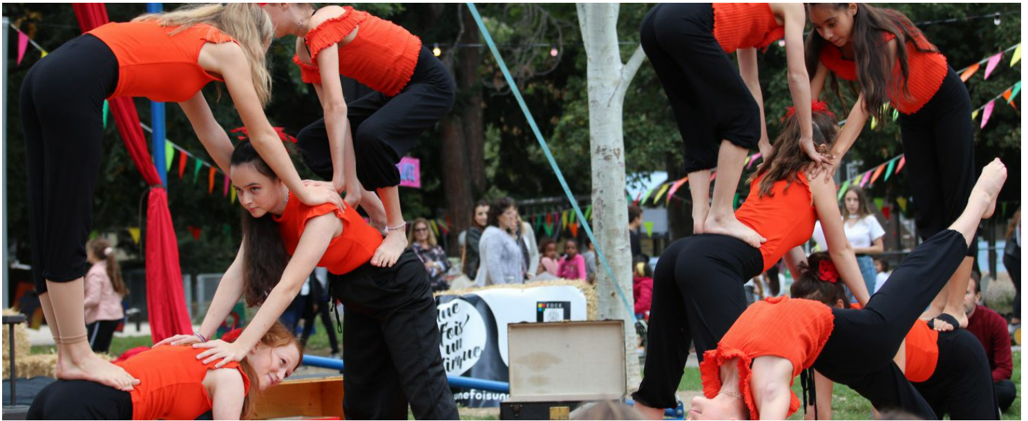
Die Zirkustruppe «Une fois, un cirque» führt Stücke vor und leitet die Workshops.