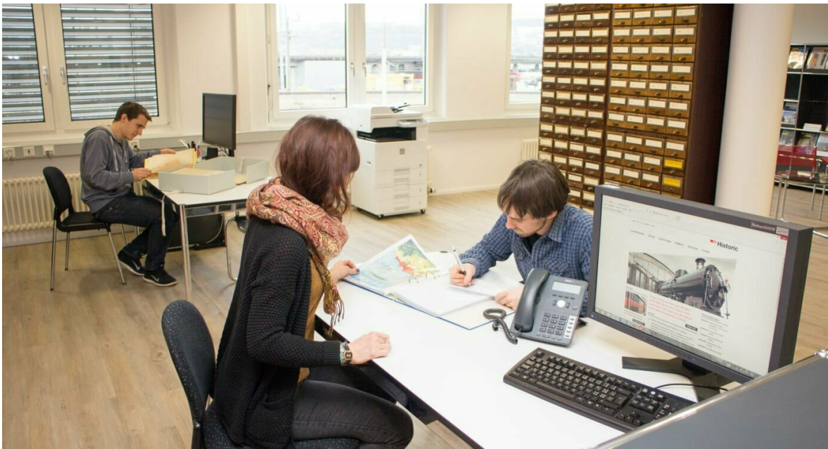
La salle de lecture de CFF Historic à Windisch

Ce qui me plaît aussi vraiment en tant qu'utilisatrice, c'est l'absence de bureaucratie et les horaires d'ouverture très larges. Quand on fait des recherches approfondies sur un sujet historique, il ne faut jamais oublier les archives d'entreprise telles que celles de CFF Historic. De nos jours, il est faux de dire que ce qui n'est pas sur Google n'existe pas, et cela restera faux encore longtemps. Il suffit d'un petit tour dans les archives pour s'en convaincre.»