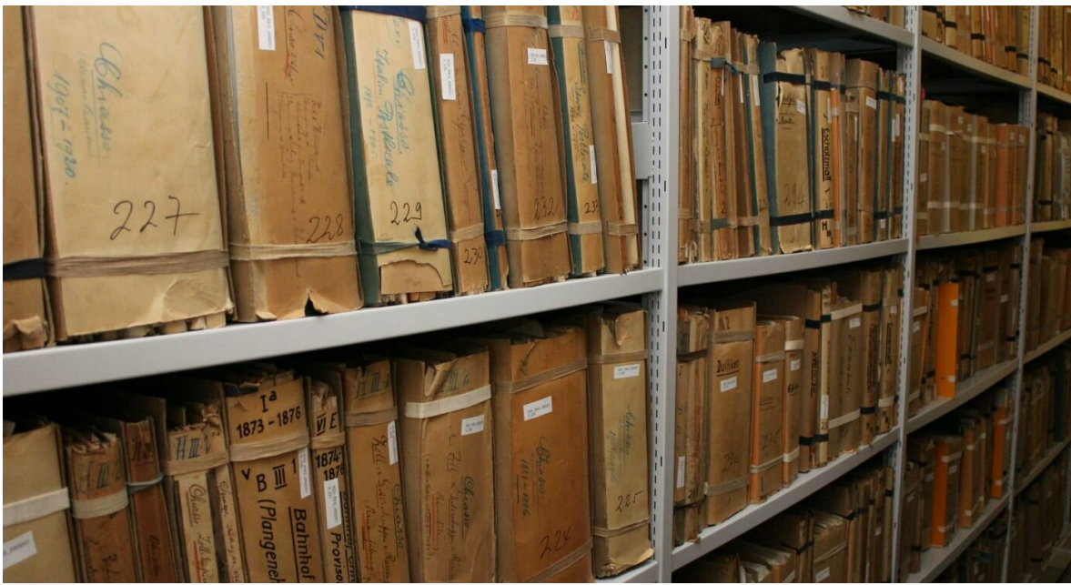
Coup d'œil dans l'un des rayonnages d'archives