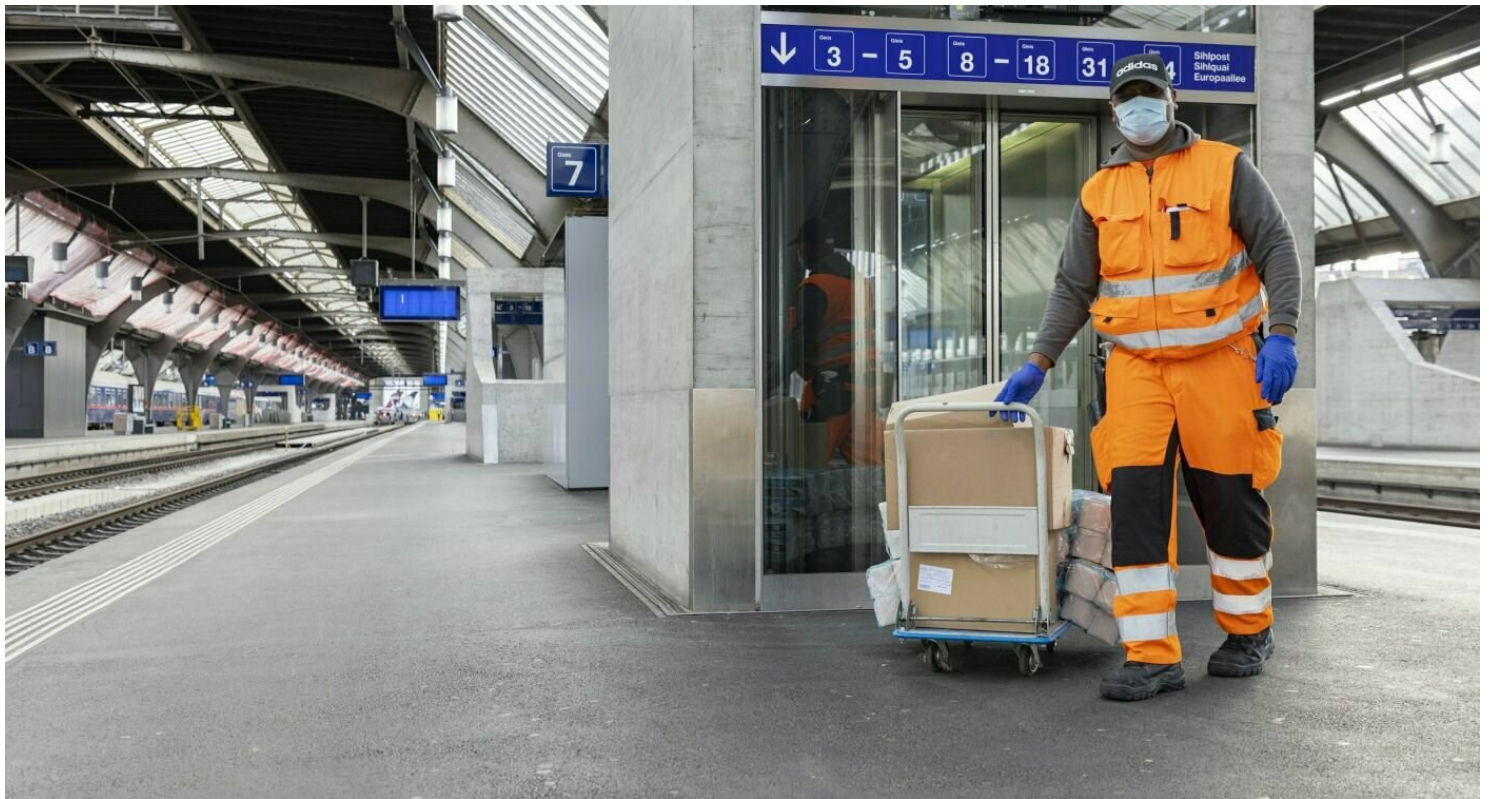
Il collaboratore indossa la mascherina anche sul marciapiede.

Secondo l'attuale stato delle conoscenze, non vi sono dati che indichino la trasmissione del coronavirus attraverso i sistemi di climatizzazione o di ventilazione. I climatizzatori a bordo dei veicoli delle FFS funzionano ad aria mista. Questo significa che l'aria esterna e l'aria di circolazione vengono miscelate e trattate nelle unità di condizionamento. La quantità d'aria fresca introdotta nelle zone passeggeri è assicurata per ogni persona e varia in base alla temperatura esterna e all'occupazione delle carrozze. In media, il volume d'aria negli scompartimenti passeggeri viene completamente rinnovato con aria esterna da 6 a 10 volte ogni ora. Questo riduce significativamente il carico di microrganismi. Per evitare l'accumulo di impurità negli impianti di climatizzazione, le FFS sostituiscono i filtri ogni 45-90 giorni.